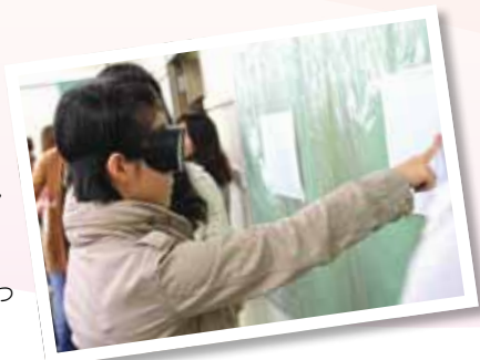
プリズム眼鏡をかけての指差し運動

当日はあいにくの雨模様だったため室内での指差し運動による実習となったのですが、その分本学のボランティア学生が1グループに1人付き添う形をとることができ、参加者と近い距離で実習を行うことができました。はじめは緊張気味の様子だった中高生たちも実習が進むにつれ緊張もほぐれた様子で、先輩学生に質問をする姿も多く見られるなど、和気あいあいとした雰囲気の実習となりました。実習終了後には、御興マネージャーから参加者それぞれの顔写真が入った『未来の女性研究者認定証』が贈られ、にぎやかに終了いたしました。