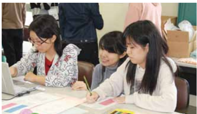
グラフを作成する参加者