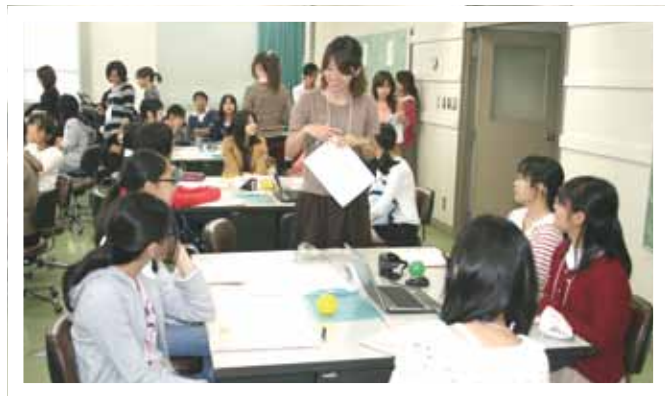
ボランティア学生による説明